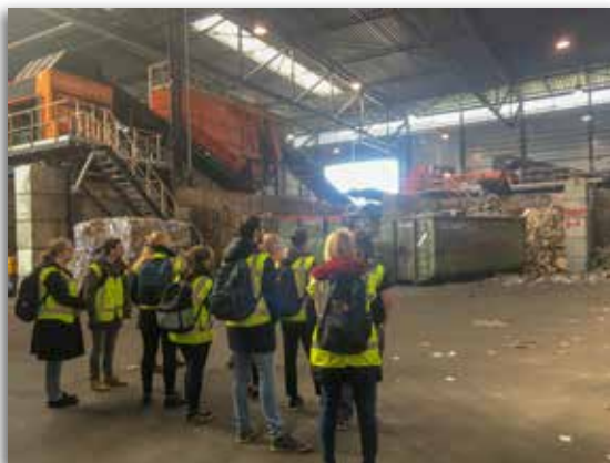
Een aantal studenten krijgt uitleg bij de unieke sorteerinstallatie van Van Happen Containers.

Tijdens de kick-off bij Van Happen kregen zo'n 40 studenten een rondleiding en flink wat informatie over afvalverwerking. Zij krijgen hierdoor niet alleen een beeld van de afvalbranche, maar dit is hun kans om details en elementen van Van Happen en afvalverwerking mee te nemen in het ontwerp van hun game.